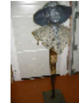
Dame op zuil

De zuil wordt gevlochten uit meerdere materialen, daarna wordt het hoofd en de hoed erop gemaakt wordt en daarna met Powertex® wordt bewerkt. Het gezicht wordt ook weer bewerkt met een speciaal poeder.